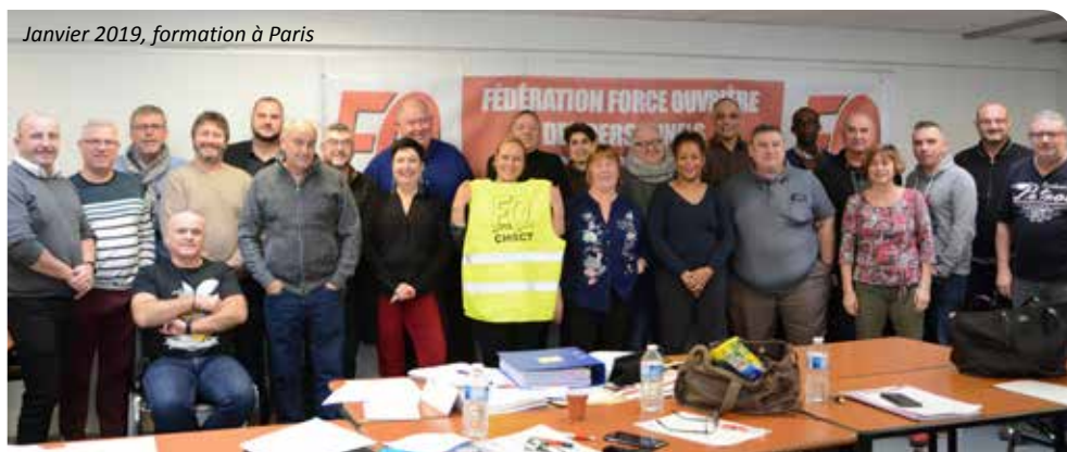
Janvier 2019, formation à Paris

Pour toutes informations complémentaires, vous pouvez contacter Pierrick JANVIER au 06.62.05.73.23 ou par mail formations.chsct@gmail.com