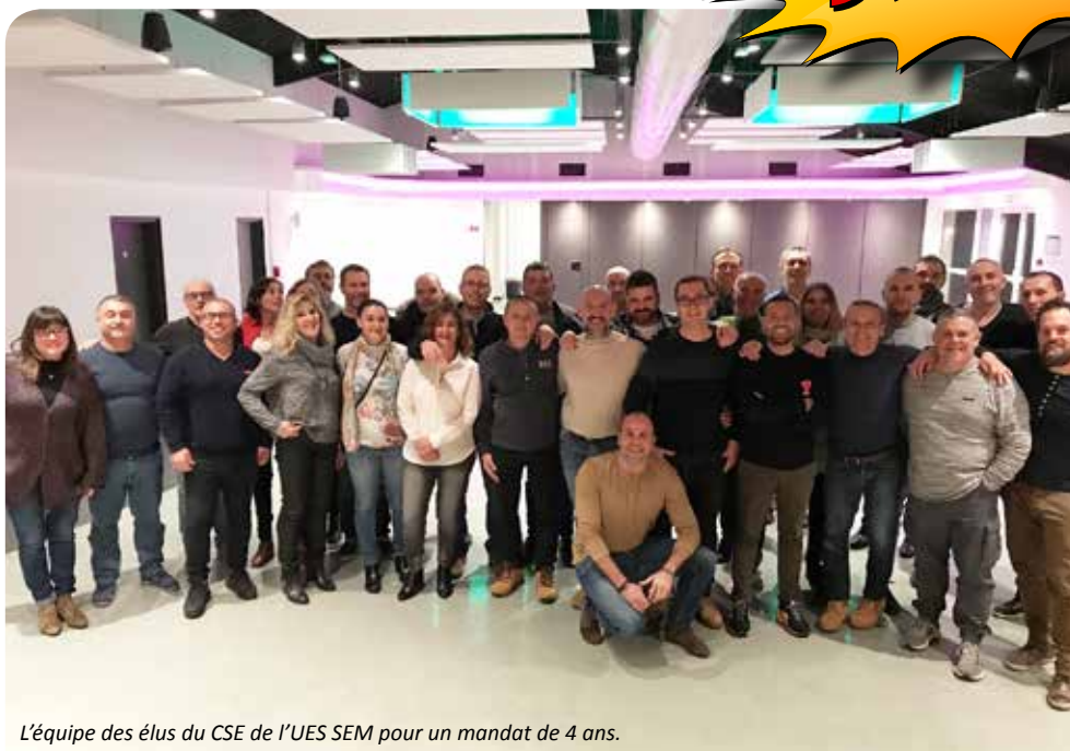
L'équipe des élus du CSE de l'UES SEM pour un mandat de 4 ans.