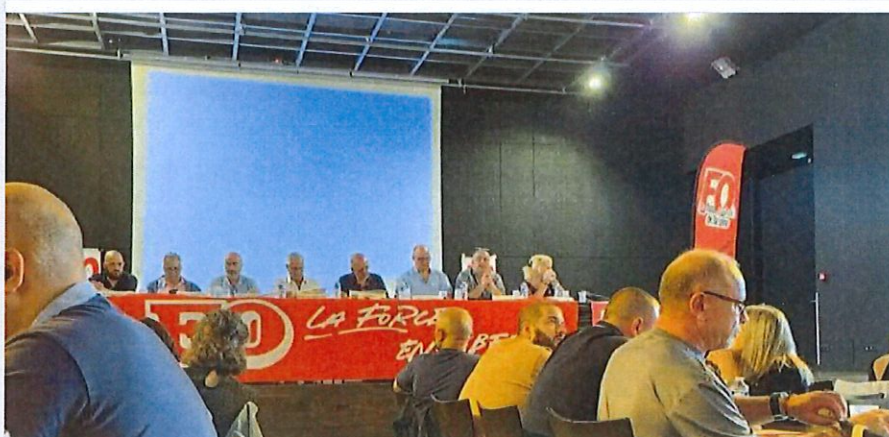
Congrès régional à Montbrison des services publics et de santé Force Ouvrière.